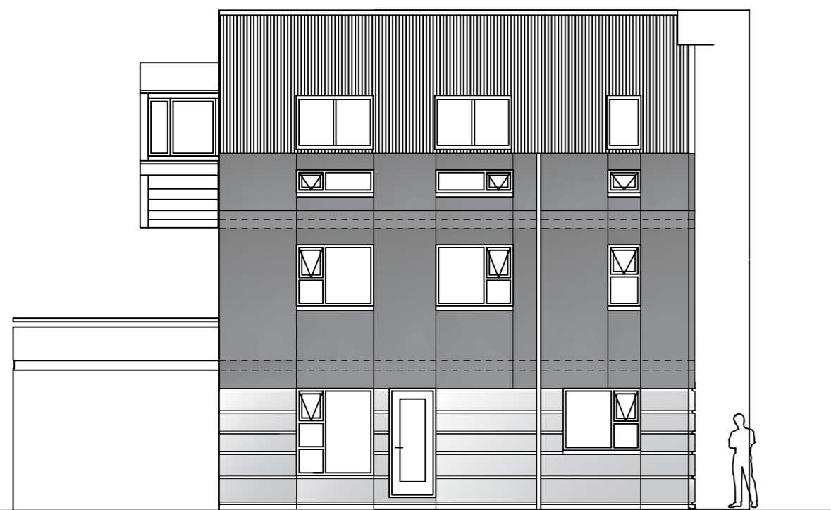
Útlit suð-austur, 1:100